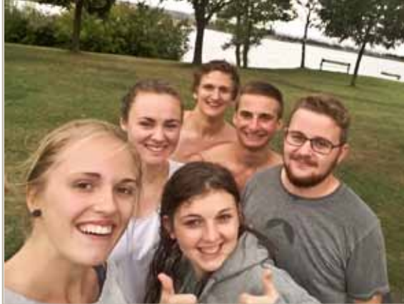
Feierabend? - Baggersee!

Karlsruhe bilden, während der „Rest“ die etwas ruhigere Zeit nutzte, sich mit den wenigen im Schloss gebliebenen intensiver zu unterhalten und diese näher kennenzulernen.